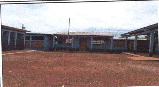
Foto 1: Cambio de cubierta de lamina del techo del aula de fondo.