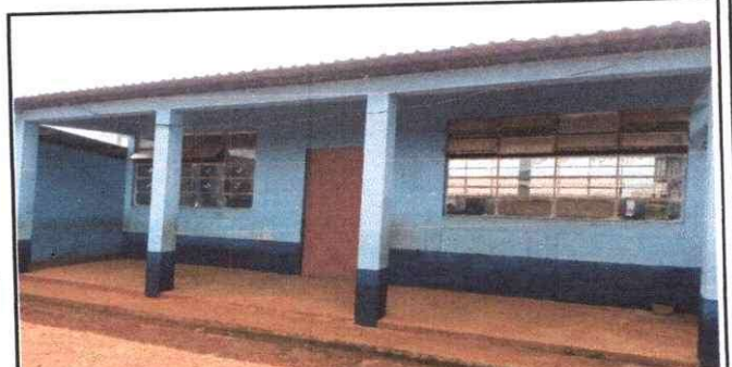
Foto 6: Mantenimiento de balcones en ambos lados del aula, se colocara barrotes con mediadas de 3x2 mts

Observación: Si es necesario se pueden agregar hojas adicionales y actualizar el número de hojas.