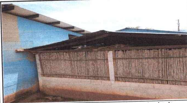
Foto 3: Sustitucion de material y colocacion de cinco ventanales de madera por metal de 2.5x1.5 mts.