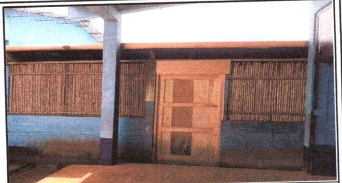
Foto 2: Mejoramiento de la cocina, incluye puerta de 1x2 mts, y el techo de cocina.